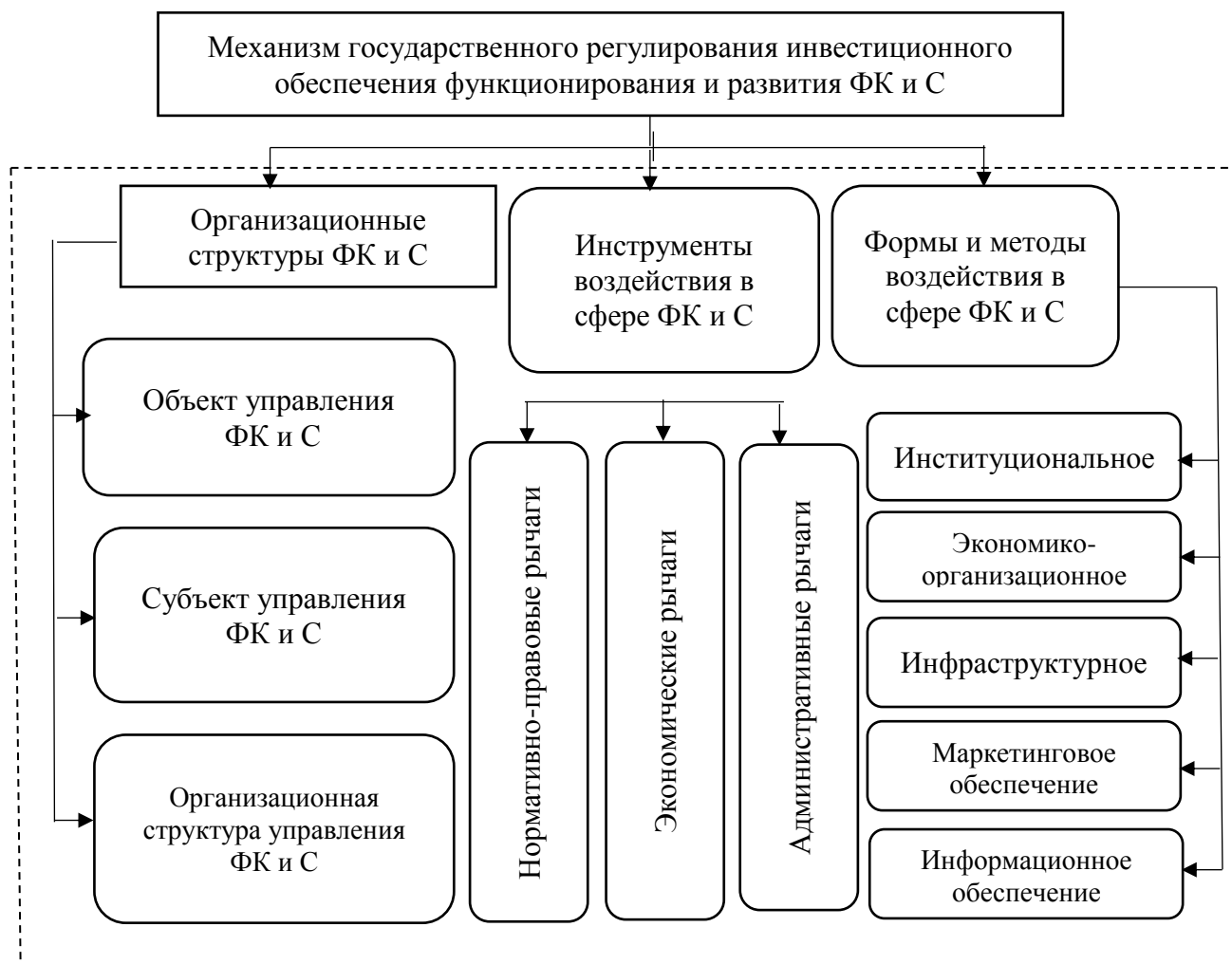
Рисунок 3 - Механизм государственного регулирования инвестиционного обеспечения функционирования и развития ФК и С (составлено автором)

регулирования предпринимательства на всех уровнях; препятствующие барьеры в процессе процедур по импорту и экспорту, а также отсутствует надлежащее сотрудничество в торговле и обмене экологической информацией.